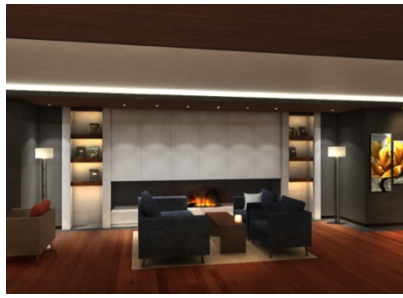
夜景も望めるピアノバー