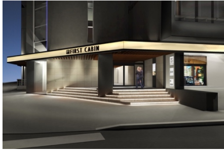
ネオンが華やかなエントランス